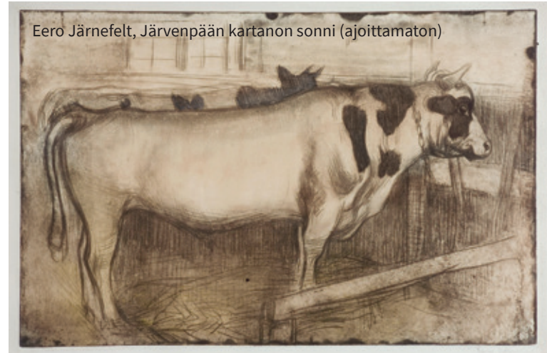
Eero Järnefelt, Järvenpään kartanon sonni (ajoittamaton)

Kokoelma on laajuudessaan kansallisesti merkittävä ja kokoelman teoksia lainataan vuosittain toisiin museoihin näyttelyihin. Kokoelman hallinta lähivuosina tarkoittaa sitä, että kokoelma tulisi käydä systemaattisesti läpi ja lisätä objekteihin asiasanoituksia, kuvailutietoja ja muita puuttuvia tietoja, jotta kokoelman tutkimuskäyttö paranee.