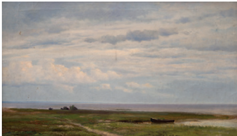
Mihail Konstantinovits Clodt, Pilvet (ajoittamaton)