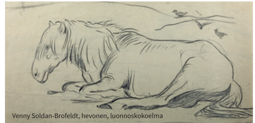
Venny Soldan-Brofeldt, hevonen, luonnoskokoelma

Luonnoskokoelma on tarkoitus asiasanoittaa ja avata tutkimuskäyttöön Finna.fi-palveluun soveltuvien osien. Asiasanoituksen yhteydessä luonnoksiin lisätään myös kaikki olemassaoleva tieto. Myös muu kokoelman taide käydään läpi lähivuosina Eero Järnefelt -kokoelman tavoin.